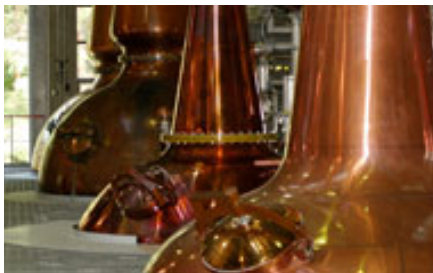
原酒を生み出す蒸溜釜